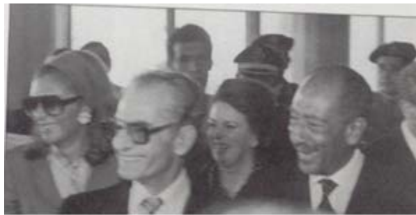
در کنار انور سادات فقید و همسرش ۱۹۸۰