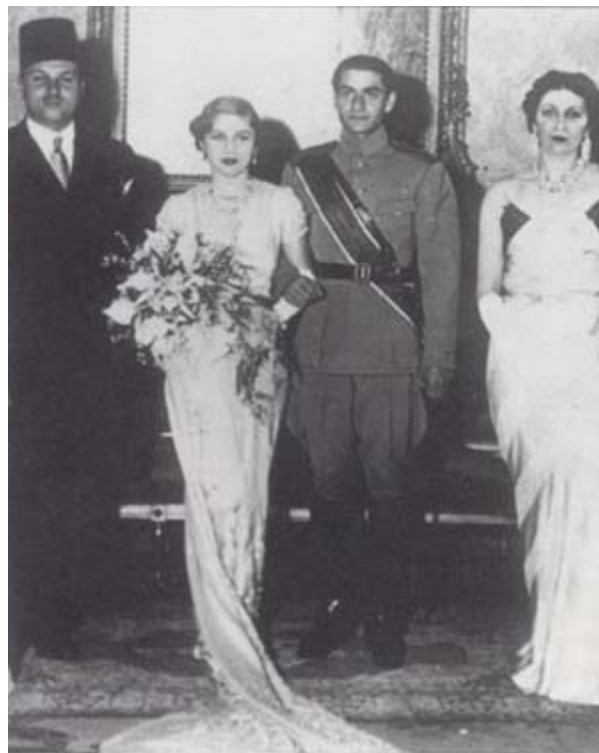
ازدواج سلطنتی - قاهره ۱۵ مارس ۱۹۳۹ محمد رضا و فوزیه در میان ملک فاروق و ملکه فریده