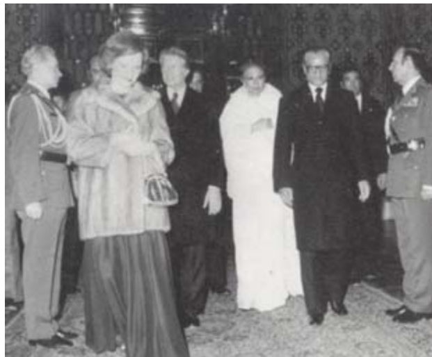
میزبان پرزیدنت کارتر و همسرش شب سال نو مسیحی ۱۹۷۸ - کاخ نیاواران - تهران