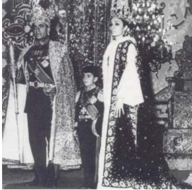
تاجگذاری - ۲۶ اکتبر ۱۹۶۷ تاجگذاری یک زن در ایران بعنوان ملکه برای اولین بار پس از ایران باستان