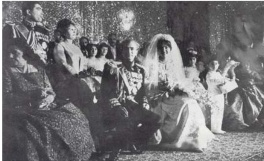
ازدواج با فرح دیبا - ۲۱ دسامبر ۱۹۵۹