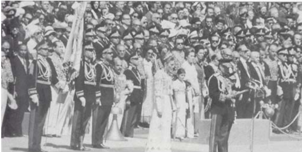
۱۴ اکتبر ۱۹۷۱