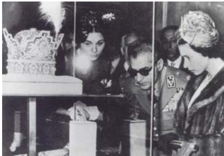
میزبان الیزابت دوم ملکه انگلستان بازدید از بانک مرکزی و جواهرات سلطنتی ایران ۶ مارس ۱۹۶۱