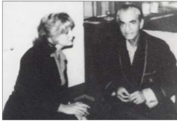
۱۹۸۰ در آخرین روزهای زندگی مصاحبه با باربارا والترز در بیمارستان