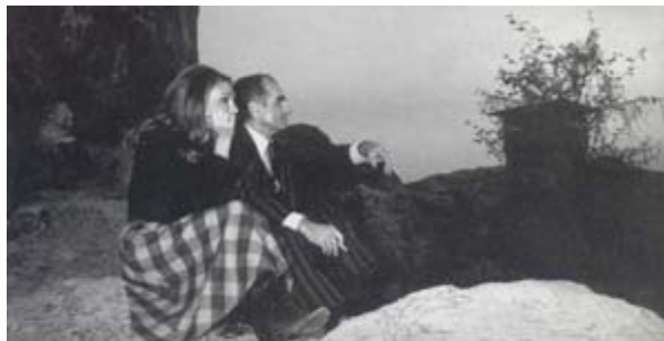
روزهای تنهایی و آواره گی - آسوان ۱۹۸۰