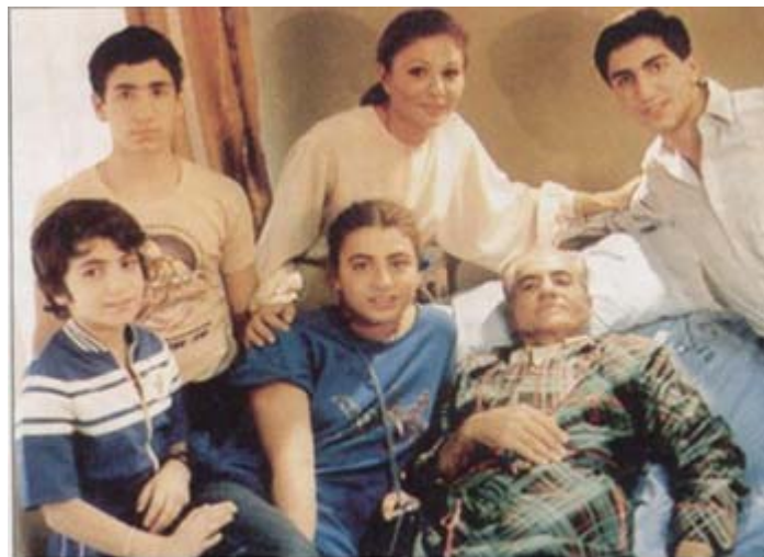
واپسین روزهای زندگی - در کنار خانواده اش