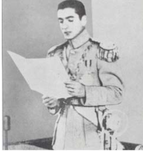
سوگند پادشاهی - ۱۷ سپتامبر ۱۹۴۱