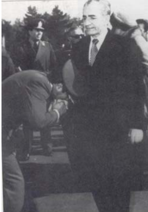
تهران ۱۶ ژانویه ۱۹۷۹ هنگام ترک ایران برای اولین بار در ملا عام گریه می کند درجه داری به التماس از او میخواهد که از کشور نرود