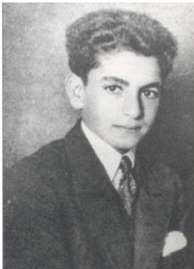
دوران دانش آموزی ۱۹۳۱