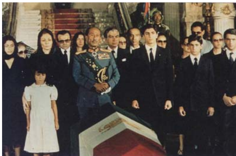
قاهره ۲۹ ژوئیه ۱۹۸۰ - پایان زندگی و رهسپار بسوی خواب ابدی