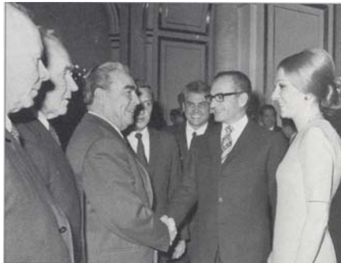
با "لئونید برژنف" رئیس اتحاد جماهیر شوروی ۱۹۶۹